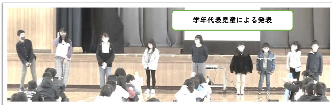
学年代表児童による発表